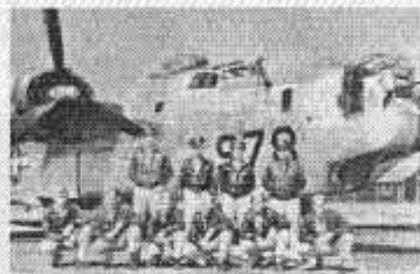
Bild 1 Flygplansbesättningen framför sin Liberator. Bild av Jan-Olof Nilsson bok "Anrop Red Dog"

Planet störtar i Hällersjö nordost om Falkenberg. På vägen ner mot marken hoppar åtta av besättningens medlemmar ut i fallskärmen. När Roger hoppar ut tror han att han är sista man, men två man var kvar och var med om en rejäl landning. En av dem begävas med en praktfull blåta och blodvite i ansiktet, men i övrigt har de varit med om sin tuffaste landning hittills och överlevt utan några större skador.