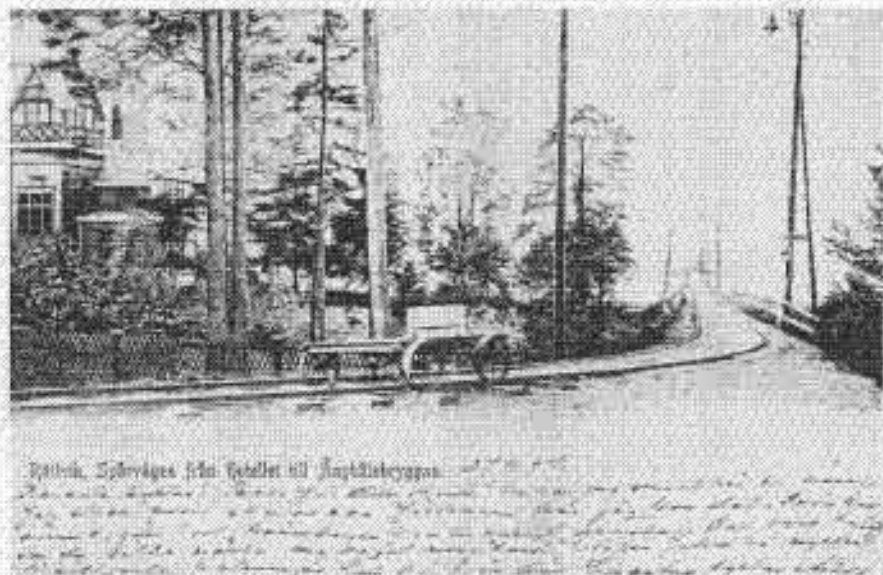
Rättvik, Sjövägen från hotellet till ångbåtsbryggan

Lycka till i framtiden med ditt samlande.