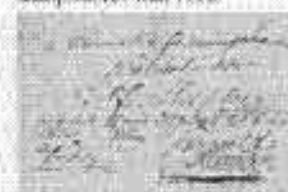
Blandpostbrev, befordrat med stämman & kronposten

Beskriver tiden från till 1874 när kronposten uppgående. Först visas två objekt till Generalguvernören för Bohuslän von Aschenberg från slutet av 1600-talet. Bland sällsynta objekt i detta avsnitt märks Kustpostbrev från 1698, ett soldatpostbrev, ett brev befordrat med både kronpost och stämman post, främst från 1695 samt snällpostbrev från 1832.