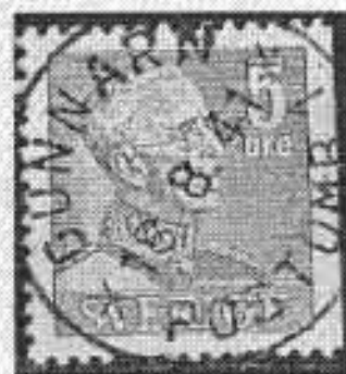
Gunnarn Postombud 1

Ett försök till beskrivning av postens organisation dessa år, alltså 1950-talet och en bit in på 70-talet skulle se ut som följer. I Grundfors by fanns postombudet Gunnarn postombud 1 åren 1959 - 1973. I Grundfors kraftverksamheten fanns inledningsvis postombudet Gunnarn pob 2 från juni till november 1954.