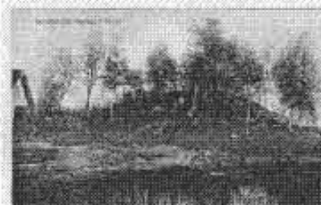
Formordisk ättbehög i Fränö

Den största kungahögen norr om Uppsala finns i Fränö. Vid den tiden, innan landhöjningen gjort sin landskapet, låg högen bara ett tiotal meter från stranden och folket leyde i omedelbar anslutning till högen. Enligt sägnen är det kungen Gudmund som ligger i högen. Idag ligger Fränö och kungahögen inom Gudmundra församling. Hur kom det sig att det fanns en så betydelsefull kung i Fränö på 500-talet? Svaret är: ett centrum för pälshandel.