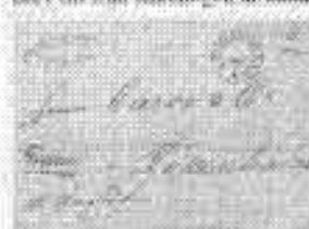
FRANCO-stämpel Uddavalla typ 1 på brev till Köpenhamn

Avsnittet visar försändelser till och från utlandet, förekommer av stämpel och postmärken samt poststritar från till 1875 när UPU etablerades. Toppobjekt i detta avsnitt är Franco-stämpeln från Uddavalla typ 11 samt Strömstad. Tidiga brev från Bohuslän till kontinenten är sällsynta. Ett sådant objekt från 1830 visar från Uddavalla till Portugal visas. Ett blandmärkesbrev (vapen-ringtyp) från Kärnboen till Riga från 1877 visas. Två liknande brev till från Klerfingen är kända.