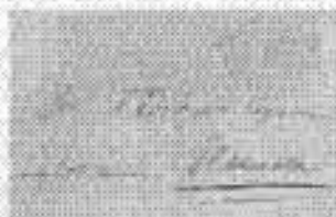
Ångbåtsbrev från 1850 Lösen nr 4 i brev

Avsnittet visar också de ångbåtspostexpeditioner som trafikerade Bohuslän och av dessa visas samtliga som förekommer på vapen. Ett unikt är främstskiljet som stämpel med Ångfartyg AB Gullmar, Främst är det enda kända, markerat med hitens egen ämnestämpel. Bland postens brev på bitarna som frakteras med norska frimärken. Dessa markerades ett med svenska ångbåtsstämpel och exponatet visar några sådana märken. Det norska, svenska frimärken som stämpels på norska ångbåtar som trafikade Bohuslän visas också.