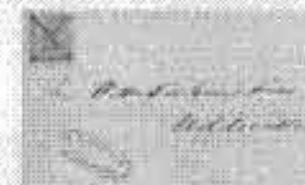
Samt med järnväg Värnersborg Uddavalla 1868

Utvecklingen från den första järnvägen i Bohuslän 1867, UWH till Bohusbanan 1903-1907 är dokumenterad. Första ideen UWH (Uddavalla-Wenersborg-Heringsås) var i bruk markerades breven med postens c. d. Exponatet visar ett sådant brev. Även ett järnvägsbrev från som direkt ut det befordrats med järnväg har befordrats med ångbått (stämplat med Ångbåtsstämpel).