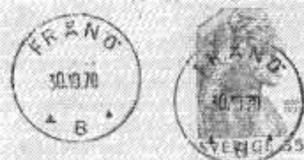
Frånö 1970-10-30 sista dag