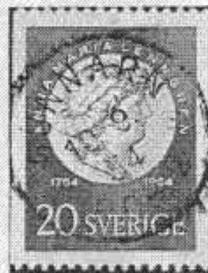
Gunnarn POB 2