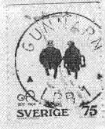
Gunnarn lbb 1