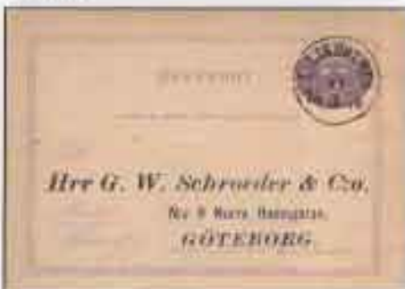
Posten ö äres brefkort, Liljeholmen 1870. Detta var den första stämplat som levererades 1870.

Fridhem intill Mälaren bestod i slutet av 1800-talet av sommarbebyggelse, med länjärns båtförbindelser till Stockholm. Kring sekelskiftet började området brändas genom att husen anpassades för permanentboende och även genom att det expanderades med ny småhusbebyggelse. En poststation med namnet FRIDHEMS VILLASTAD öppnades 1906 och blev underställd Liljeholmen, som ju ett par år tidigare öppnats som postkontor.