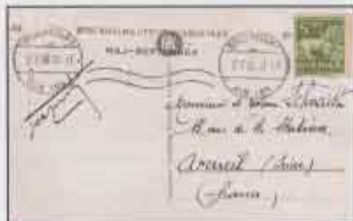
Maskinstämpel Stockholm 1 AVG-LBR 8 7.30 10 11 med "reklamtext" om utställningen på utrikes tryckverk med 5 öres porto till Frankrike.

Under utställningen användes också stämpeln "Stockholm Skansen" plus dag, månad och år (Nst 62b). Denna stämpel är mer sällsynt förekommande och nyttjades vid ett brevsamlingsställe med detta namn. Detta "ställe" skulle enligt ett postalt cirkulär vara "anordnat" tiden 15 maj - 31 augusti. Under betydligt längre tid nyttjades de maskinstämplarna som under 1929 och 1930 gjorde reklam för utställningen (maskinstämpel 424). Dessa stämplarna var i bruk vid Stockholm 1, 7 och 16. Även här hänvisas till "Svenska maskinstämplarna 1891-1989" för närmare upplysning om nedre text och användningstider.