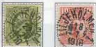
Poststämplat från postkontoret Liljeholmen 1

stadsområden av sämre standard växte också upp. Ett av dessa låg i Gröndal och där inrättades viss postservice 1906 i form av ett brevsamlingsställe med namnet LILJEHOLMEN 2. Det var anledningen till att postkontoret fick namnet LILJEHOLMEN 1 från samma tid. Jag har inte lyckats hitta någon närmare information om brevsamlingsstället förutom det som framgår av ett postcirkulär 1906, där det arges att läget var huset nr 13 vid Granvägen i Gröndals villastad.