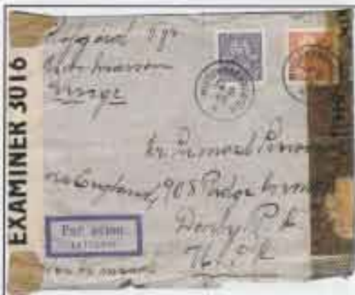
Brevstämpel Midsommarkransen 14.9.1943 till USA med exempel på krigsårens höga luftposttaxor, här 1,05 kr (brevporto 30 öre, tillägg luftpost 75 öre/5 gram)