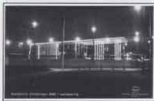
Fotografiskt vykort i det mindre formatet av en genomtänkt belysningsarkitektur som knappast överträffas av dagens nattmiljöer.

Utöver de officiella nummerade vykortet förekommer ett avsevärt antal fotografiska vykort i mindre format, cirka 135x90 mm framställda av Calegi, Almqvist & Winholm, Skandinaviska Kortcentralen m.fl.