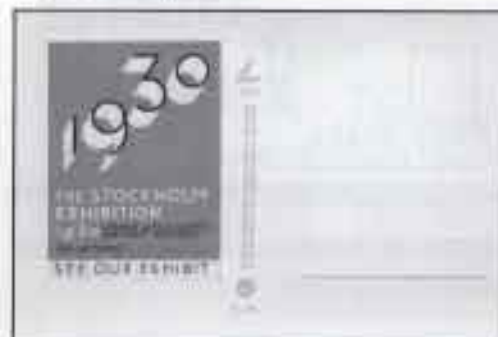
I typografin för året 1930 har enkelhet, lätthet och rymlig eftersträvat. Officiellt vykort nr 32 med publikstrat bevismärke utfört som miniatyr av utställningsaffischen.

Även utställningens reklamaffisch ger uttryck för den nya design som blev populär. Arkitekten Sigurd Lewerentz utformade utställningens karakteristiska typografi som direkt anslöt till de nya modernistiska blockstilarna där futuran är den mest välkända.