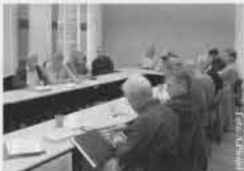
En höstmöte år 2005 på Postmuseum.

Det absolut viktigaste för styrelsen var att finna former för kontakt med medlemmarna. Redan 1984 kunde styrelsen börja utge föreningens tidskrift Hembygdssamlaren. Inledningsvis utgavs två nummer per år men sedan 1988 utges fyra nummer per år. Vart tredje år kommer en aktuell matrikel där medlemmarnas samlingsområden redovisas.