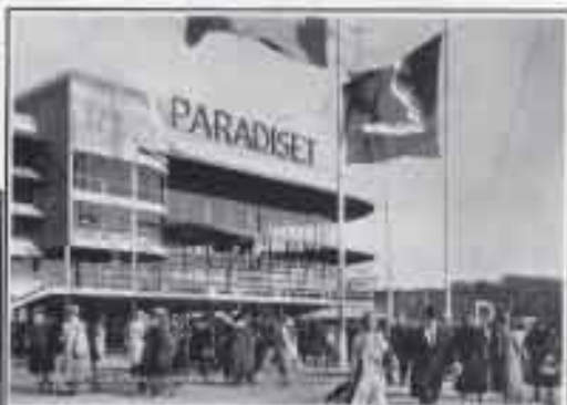
Restaurang Paradiset vid festplatsen med folk och med ropande flaggor som bar utställningens symbol.

Tvåer finns i dag bara minnena kvar av utställningsbyggnaderna. När utställningen avslutats revs allt och nästan ingenting finns bevarat. Byggnaderna var konstruerade för avsedd användning endast under utställningstiden. Emellertid kom detta utropskecken i form av arkitektur och konstverk att få stor betydelse för framtiden både i Sverige och internationellt. "Funkisen" kom för att stanna. Än i dag återoppos till exempel den lätthet och moderna elegans som restaurang Paradisets fasad uppvisade mot festplatsen.