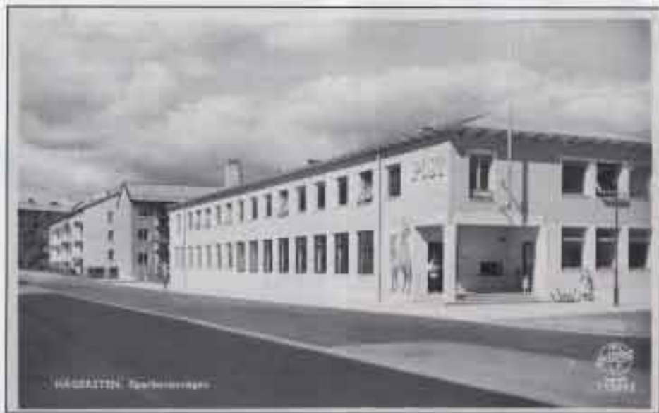
Posthuset Hägersten 1 på Spårbankevägen från cirka 1950. Huset är beläget mitt emot Medborgarhuset, utställningslokaler för HOLMEX 08.

Postkort (från Gotland), semesterhälsning i augusti 1980 från avsändare som inte hade sin adressbok med sig. Adressen anger Hägerstenavägen men saknar både gatuadress och postnummer. Rektangulär expeditionsstämplat Postkontoret Hägersten 1. Adressundersökningen (gatuadress och postnummer) (fyllda med röda siffror).