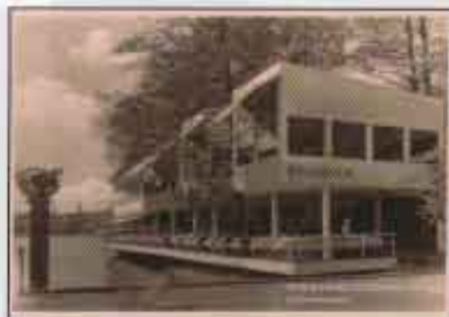
Parkrestaurangen med kvadratisk formade fönster. Husen står på ben, upplysta från terrassen. Officiellt vykort nr 53.

Termen funktionalism stod vid denna tid för något alldeles nytt, där byggnadernas arkitektoniska uppbyggnad skulle avspejla deras innehåll - "form follows function" sammanfattade idelogin. All onödigt ornamentik skulle avskaffas. Modern byggnadsteknik som industrisamhället hade utvecklat skulle användas för att skapa ändamålsenliga och billiga bostäder och andra byggnader för den moderna människan.