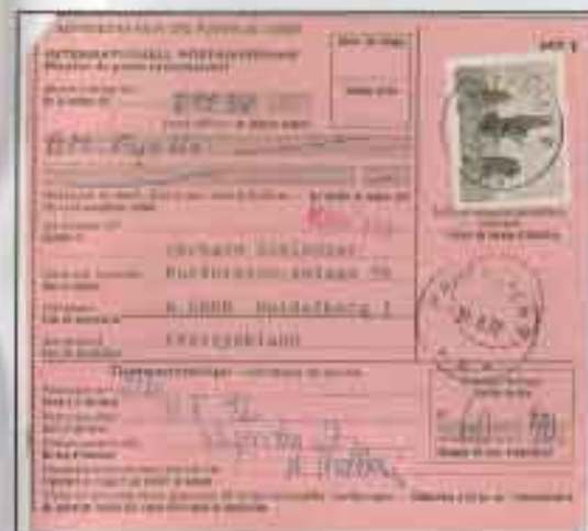
Internationell posttjänstning stämpel Hägersten 9 i Aspudden (Örnberg)

Innan 1960-talet var slut fick Hägersten se ett par av sina postkontor bli indragna. Hägersten 3 och Hägersten 7 upphörde 1968. Nästa indragning dröjde dock till 1982, när Hägersten 8 hade tjänat färdigt. Under 1990-talet försvarar merparten av de övriga inklusive postkontoret Hägersten 1 i sin gamla roll. Som centrum för områdets postdistribution tycks det dock ha levt vidare fram till nutid.