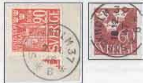
Stämpel från postexpeditionerna på Hägerstensåsen, Stockholm 37 och Stockholm 39, från 1946 respektive 1947.

postexpedition. De fick namnen STOCKHOLM 37, i södra delen av åsen, respektive STOCKHOLM 39 längre norr ut. Det var något av ett litet värteläge, innan centrumanläggningen på åsen stod klar 1950.