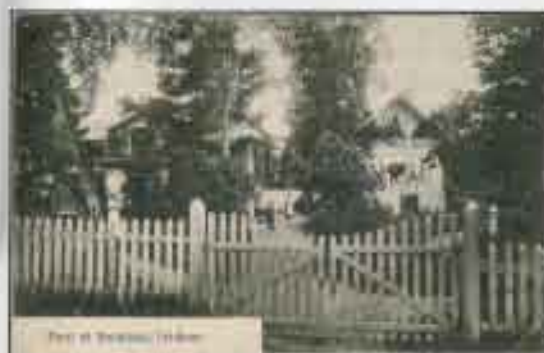
Vykort med lokalt motiv från Fridhem, stämplat Fridhems Villastad 21 maj 1907. Not 33.

Liljeholmen blev en industriföret under senare delen av 1800-talet och ett par bo-