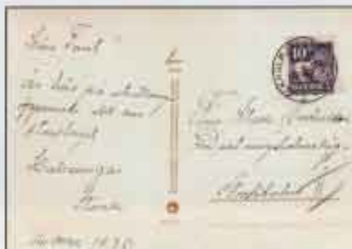
Litställningsstämpeln på officiellt vykort nr 16 använd på invigningsdagen. Läs även texten: "Kära Tant! Är här på utställningens öppnande, det var storslaget".

Naturligtvis hade detta evenemang, som i alla avseenden var så välordnat, även egen posthantering. Denna skedde på ett tillfälligt postkontor, kallat "Stockholmsutställningen 1930". De stämplarna som förekom är dels en skaffstämpel med texten "Stockholmsutställningen" plus dag, månad och år (Nst 62b, se bild nedan), dels en maskinstämpel med texten "Stockholmsutställn." plus dag, månad, år och även klockslag (maskinstämpel 208, se SFF-handboken: "Svenska maskinstämplarna 1891-1989"). Båda dessa stämplarna kom att användas under hela utställningstiden.