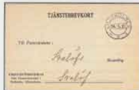
Tjänstebrevkort stämplat 1927, dvs från sista perioden 1926-31 när postkontoret åter hette Liljeholmen utan ett efter.

ret (i praktiken flyttades) och ersattes av det nyinrättade och närliggande postkontoret Stockholm 9 på Södermalm.