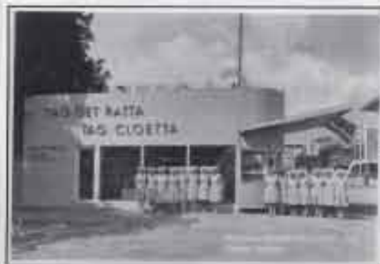
Arkitektur och reklam - och en ytterst levande sådan - på officiellt vykort nummer 118.

Att reklamen lyftes fram och integrerades med byggnadens arkitektur ser man flera fantastiska exempel på. Det utställningsvykort som återges nedan visar också "levande reklam" i form av prydligt uniformerade Cloetta-flickor framför den funktionalistiskt eleganta paviljongen.