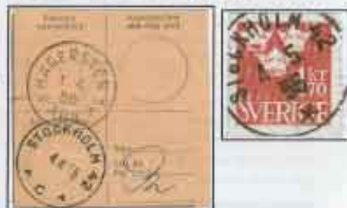
Stämpel på klipp från baksidan av paketadresskort från 1950-talet, som visar ett pakets ankomst till postkontoret på Hägerstensåsen, stämpel 1.4.55 Hägersten 1 Ark, paketet utlämnat 4.4.55 via Stockholm 42 i Västberga.

Att Stockholm behölls som postnamn i två fall beror säkerligen på att dessa delar var företagsintensiva och att det därför var mer praktiskt med adressort Stockholm.