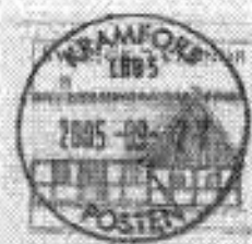
KRAMFORS LBB5 Klockestrand-Svano-Nensjö