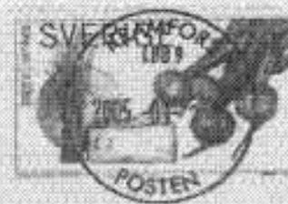
KRAMFORS LBB9 Torrom-Lövyik-Nyadal