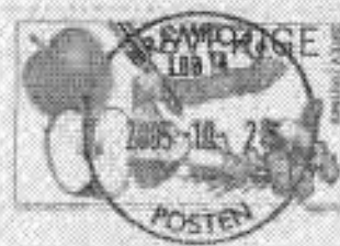
KRAMFORS LBB14 Ullånger