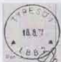
Tyresö 1 LBB2