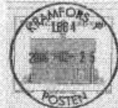
KRAMFORS P LBB4