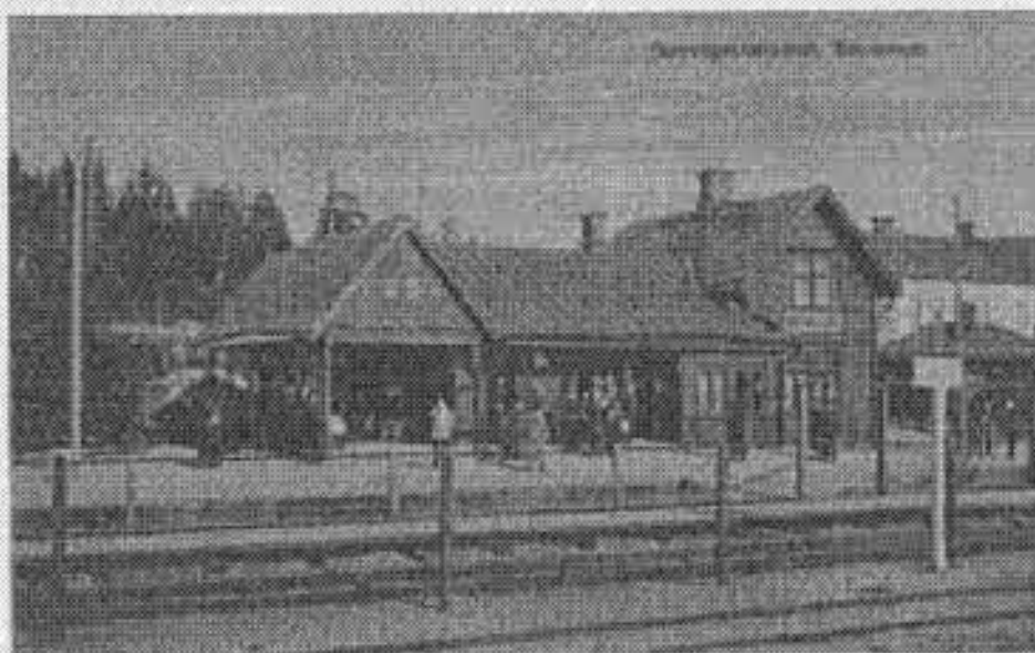
Järnvägsstationen i Bromsten

Tombolaget AB Billiga tomter var aktivt när det gällde att sälja tomter. Med en växande befolkning öppnades den 23 juni 1900 Bromstens hållplats och lastplats söder om Spånga järnvägsstation. Stationshuset invigdes den 1 juli 1902. I stationshuset hade en lokal inrett för en poststation som också öppnades den 2 juli 1902. Den blev Spångas tredje poststation efter poststationen i Spånga och Riddersvik. Man använde där en stämpel med texten Bromsten fram till den 31 december 1960. Den 10 juni 1904 blev Bromsten ett municipalsamhälle inom Spånga landkommun.