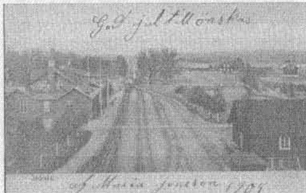
Jädrads järnvägsstation på ett vykort som skickades 1905.

Sedan stationshuset färdigställdes 1884 har huset genomgått otaliga om- och tillbyggnader. För att få plats med fler kontor samt en 2:a klass vagnsal gjordes 1899 en tillbyggnad av huset med två likadana flyglar, en i västra och en i östra delen av huset. 1911 fick stationshuset sitt nuvarande utseende genom ännu en tillbyggnad i den östra delen.