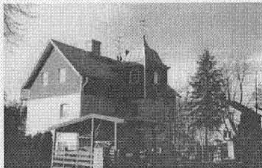
Villa Gröna Lund, där posten låg åren 1920—1939

Den 1 oktober 1955 upphöjdes poststationen till postexpedition med fullständig postal service. Ortnamnet Bromsten försvann den 2 januari 1961 från postens stämpel då postexpeditionen bytte benämning till Spånga 2. Bromstens järnvägsstation upphörde som hållplats den 16 april 1968.