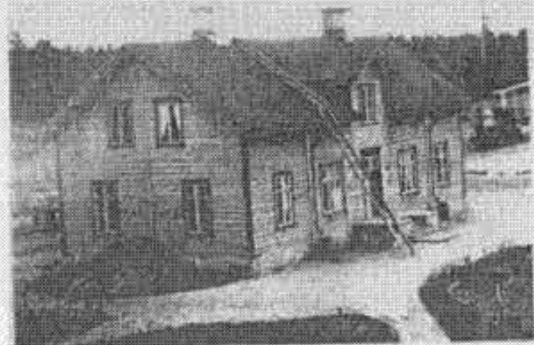
Bild från 1891. Jädraås järnvägs- och poststation

senare befordrad till poststationsföreståndare. Den tjänsten hade hon sedan till 1945. Poststationen i Jädraås inrättades i järnvägens stationshus. Där disponerade den ett rum som hade en lucka i väggen mot väntsalen. Under 1920-talet flyttades postkontoret till ett annex som låg strax intill järnvägsstationen. Där fanns den under ett 30-tal år innan den på 1950-talet flyttades tillbaka till järnvägsstationen.