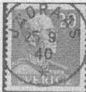
Nst 59b 1935-68