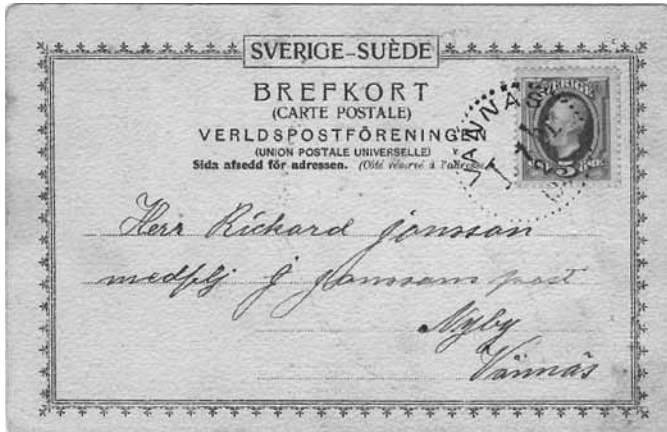
Brefkort med Vännäs Lådbrevstämpel (Normalstämpel 21 Lbr). Notera adressen: Nyby (sic!) Vännäs.