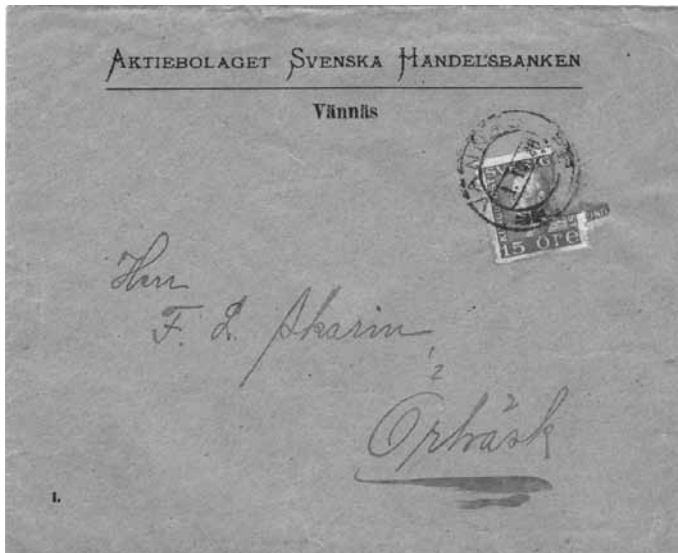
Försändelse från Vännäs med Normalstämpel 58q (två sirater). Denna stämpel är så svår att man får vara nöjd med defekta exemplar på försändelser.