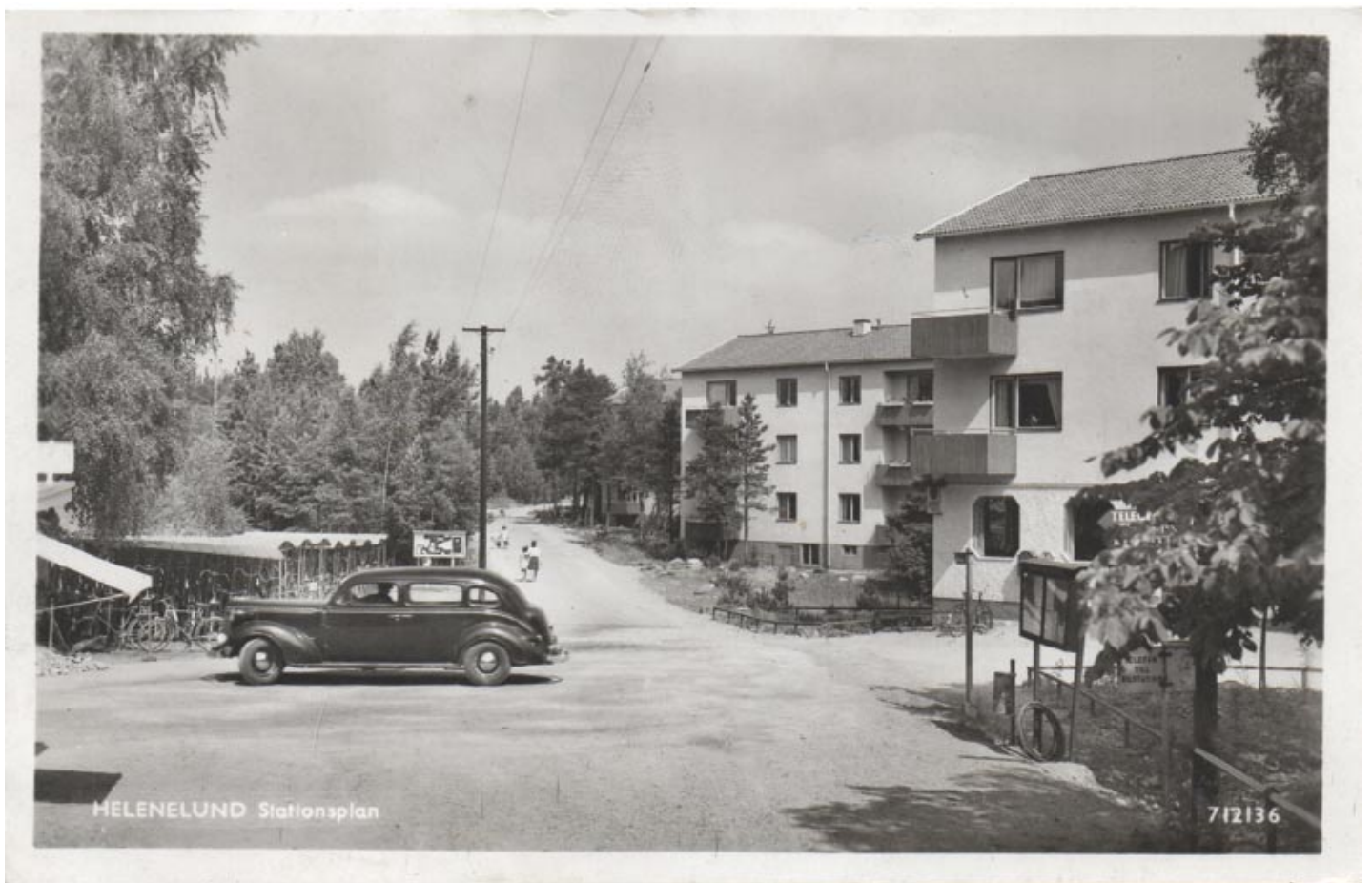
Stationsplan. Under balkongen syns postskylten