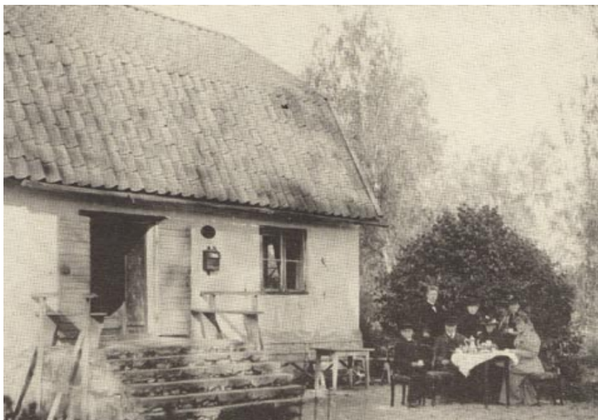
Ängstorp, Turebergs första poststation