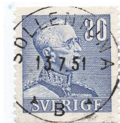
Sollentuna nst 60B