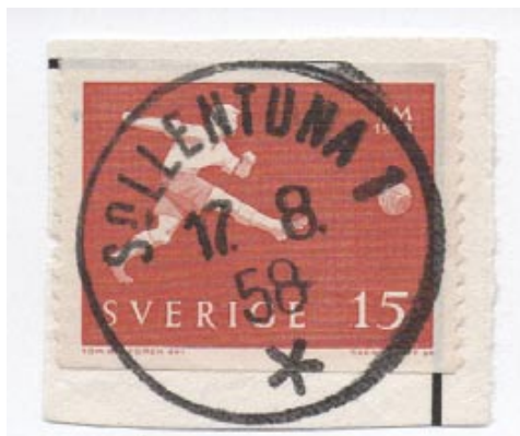
Sollentuna 1 nst 59G