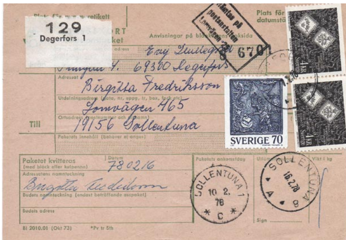
Adresskort med Sollentuna 8 Nst 60A

Resan går vidare mot den senaste postexpeditionen som öppnades i Sollentuna. Den låg i Kärrdal på Lomvägen. Postexpeditionens historia blev kort bara 17 år. Brev som är stämplade Sollentuna 8 är sällsynta.