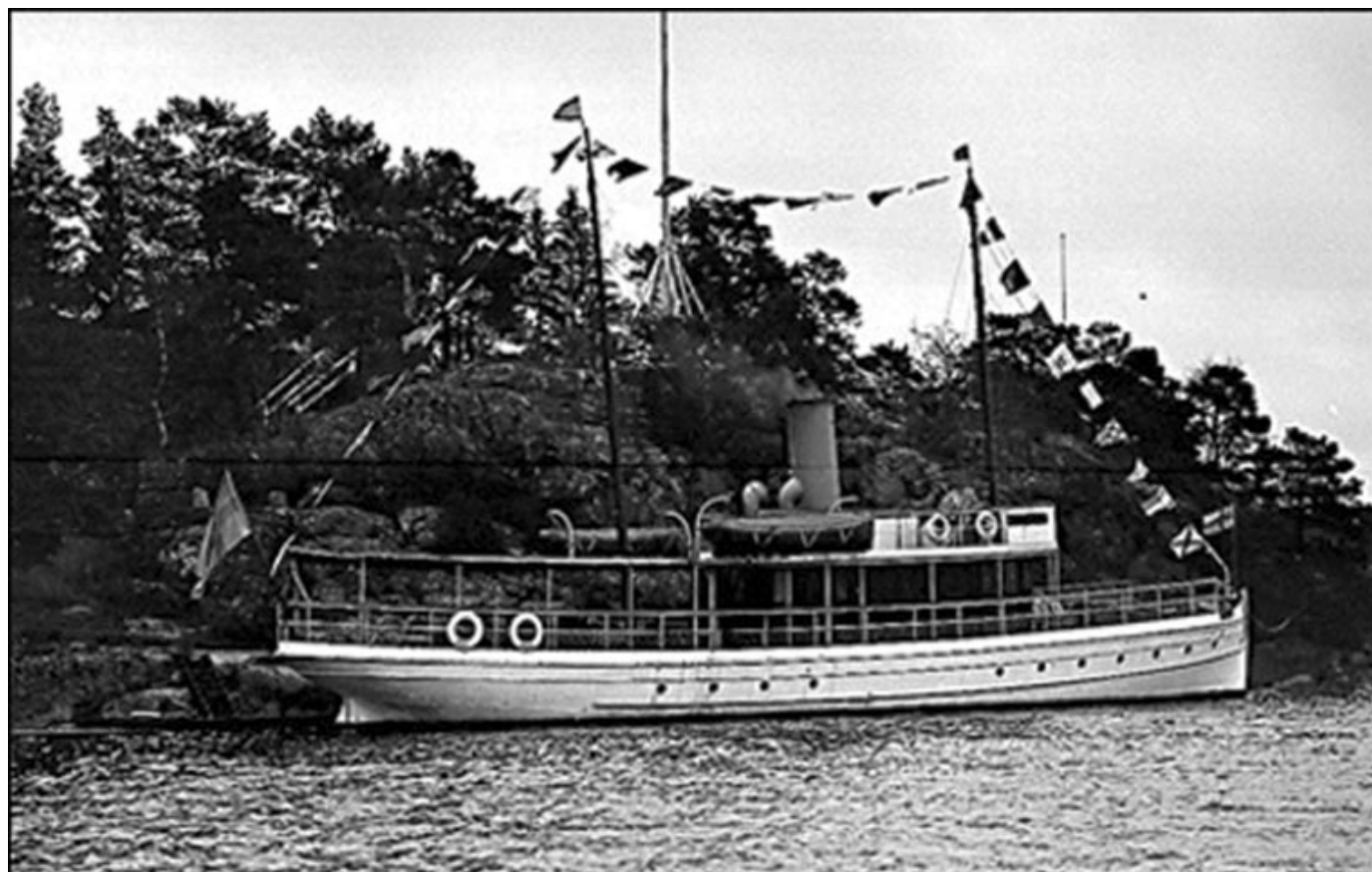
Brage byggdes 1872 av Lindholmens varv i Göteborg.

Det är nära till ångbåtsbryggan vid Edsbergs slott i Edsviken och där kunde man kliva ombord på ångbåten Brage.