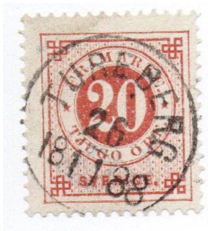
Tureberg nst 16

År 1900 stod stationsbyggnaden klar och posten inrymdes den 1 oktober i stationen. Stämpeln benämndes Tureberg fram till den 30 september 1947 och kallades sedan Sollentuna fram till den 31 december 1951. Från 1 januari 1952 namngavs stämpeln Sollentuna 1 fram till 2002-11-14.