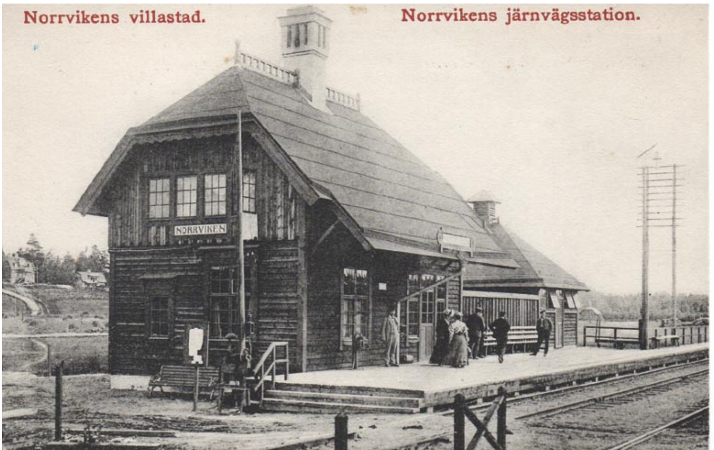
Ett tidigt vykort på stationen Norrviken då posten var inrymd där

Ortnamnet Norrviken i stämpeln användes fram till den 31 december 1968 och från den 2 januari 1969 blev stämpeln Sollentuna 6 fram till 24 september 1999. Dvs sista meningen ska strykas. Stämpeln hette Sollentuna 6 hela tiden.